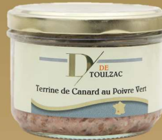
D DE TOULZAC Terrine de Canard au Poivre Vert 180g