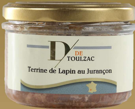
D DE TOULZAC Terrine de Lapin au Jurançon