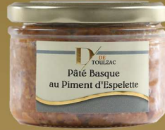
D DE TOULZAC Pâté Basque au Piment d'Espelette 180g