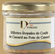
D DE TOULZAC Rillettes Royales de Confit de Canard au Foie de Canard 20% Foie Gras 90g