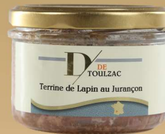
D DE TOULZAC Terrine de Lapin au Jurançon 180g