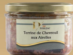
D DE TOULZAC Terrine de Chevreuil aux Airelles 180g