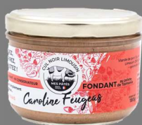
Fondant Cul Noir au Poivre de Tasmanie 180g