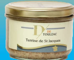
D DE TOULZAC Terrine de Saint Jacques 200g