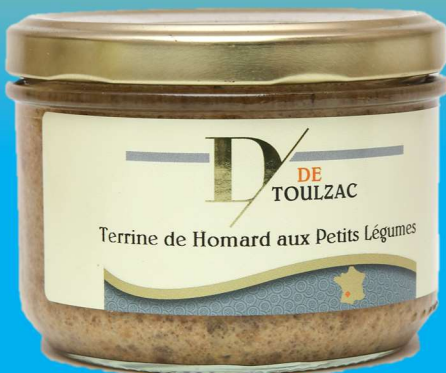
D DE TOULZAC Terrine de Homard aux Petits Légumes