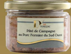
D DE TOULZAC Pâté de Campagne au Porc Fermier du Sud-Ouest 180g