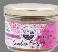
Rillettes de Cul Noir 180g