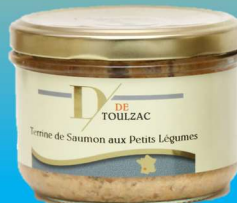
D DE TOULZAC Terrine de Saumon aux Petits Légumes 200g