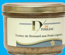
D DE TOULZAC Terrine de Homard aux Petits Légumes 200g