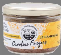
Pâté de Campagne de Cul Noir 180g