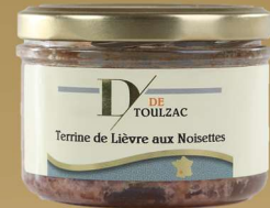
D DE TOULZAC Terrine de Lièvre aux Noisettes 180g