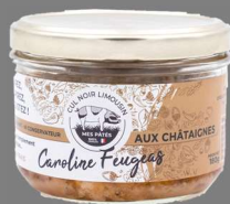
Pâté de Cul Noir aux Châtaignes 180g