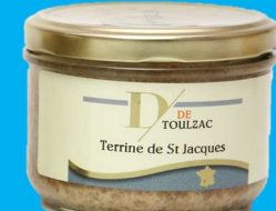
D DE TOULZAC Terrine de Truite Fumée aux Algues 200g