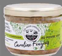
Pâté de Cul Noir au Poivre Vert 180g