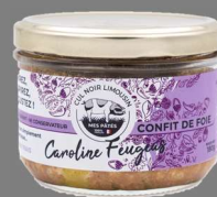
Confit de Foie de Cul Noir 180g