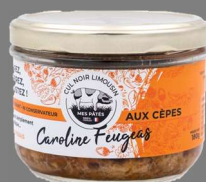
Pâté de Cul Noir aux Cèpes 180g